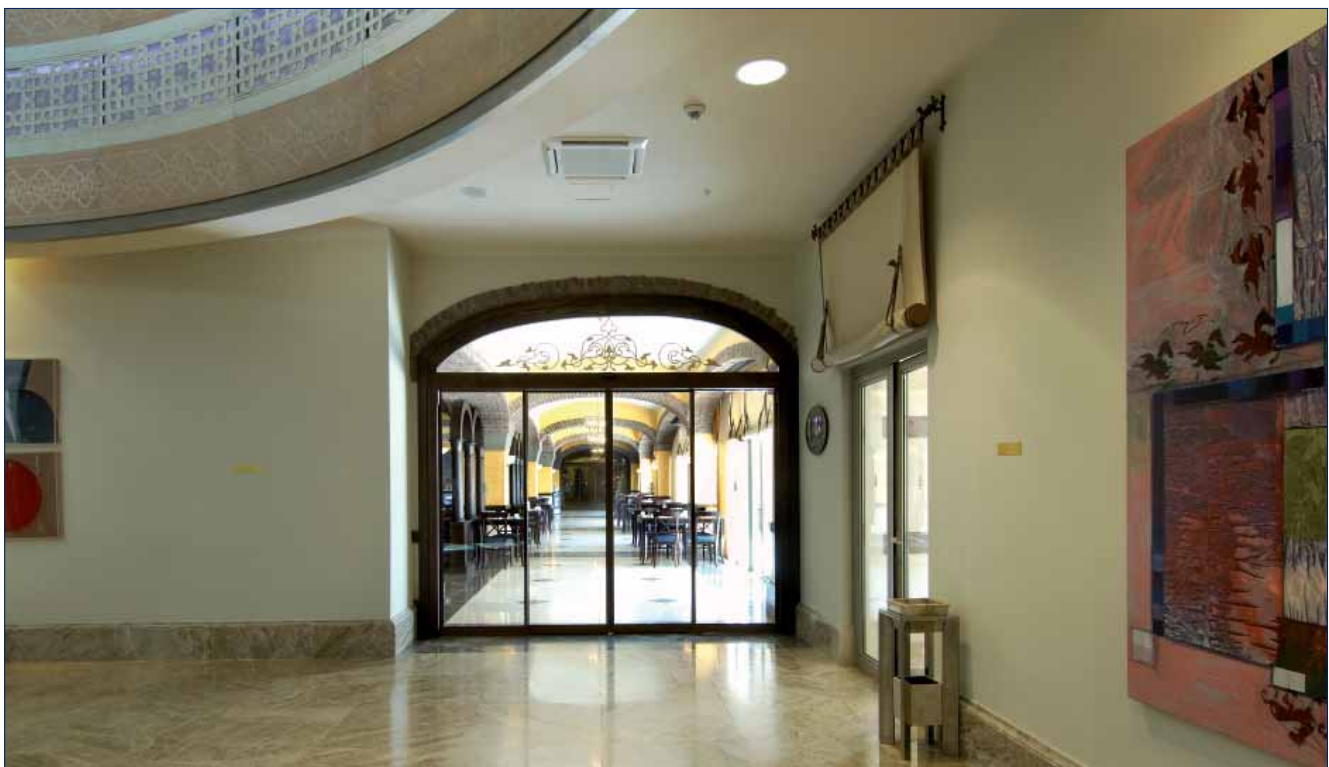
Hotel Kempinski, Antalya

Мощный двигатель 400 Нсм и редуктором в герметичном корпусе, маломощный.